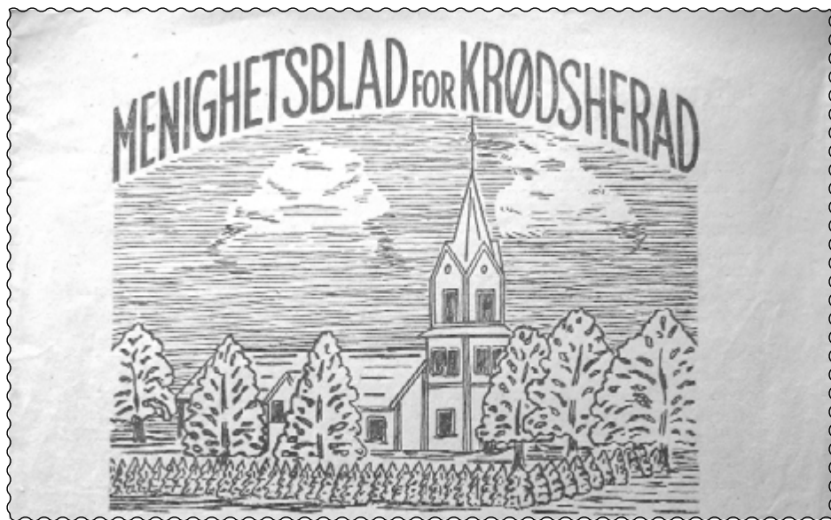
Første nummer av Menighetsblad for Krødsherad, september 1945.