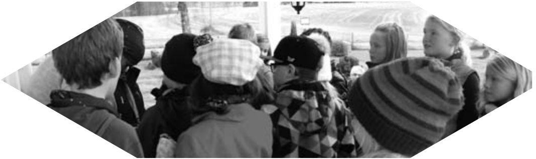
Tårnangerter på vei inn i kirka for å sjekke spor.